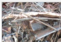
Cu-Schrotte aus den GUS

Hier erfahren Sie mehr über unser Unternehmen. Wer wir sind, unsere Arbeitsweise und wofür wir stehen.